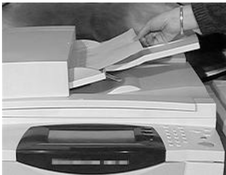
Alimentador de topo