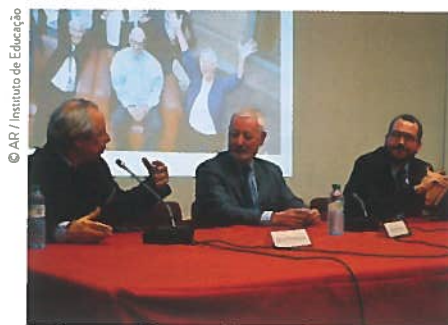
© AR / Instituto de Educação David Rodrigues, António Sampaio da Nóvoa e João Costa